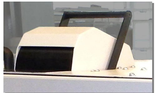
Optional: Sondertrichter mit elektrischer Verriegelung/Freigabe für Aufgabe der nächsten Festplatte und Zählrichtung