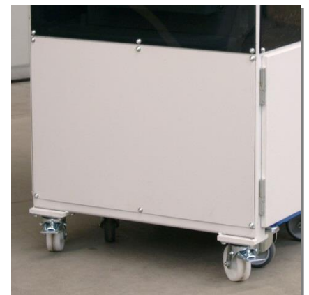
Machine auf lenkbaren Rollen