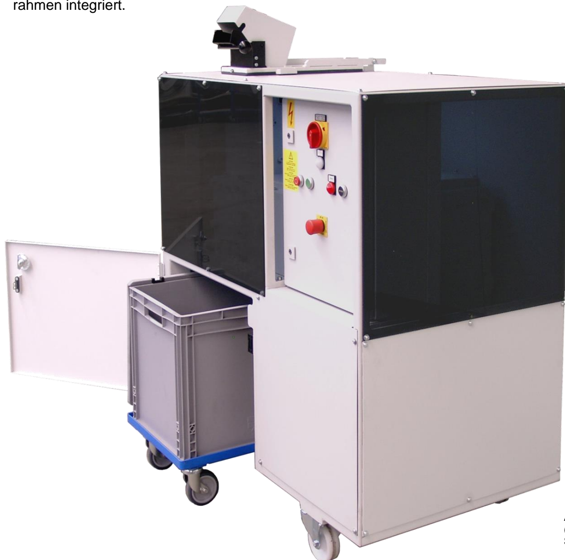
Abb.: JBF HD 15/40 Office (Abfall-Container nicht im Standard-Lieferumfang enthalten)

Auto-Reverse bei Überlast mit automatischem Wiederanlauf. Maschinenstopp nach dreimaligem Reversieren. Durch den Direktantrieb der Schneidwellen entfallen die Antriebsketten. Dadurch ist die Anlage besonders wartungsarm und staubunempfindlich. Der Schaltschrank ist platzsparend in den Maschinenrahmen integriert.