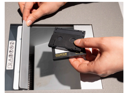
Kleine Magnetbänder sowie CDs, DVDs und Blu-rays werden geshreddert