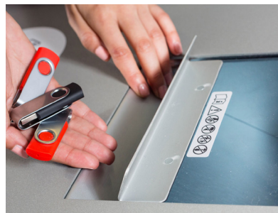
SSDs, USB-Sticks, SD-Karten und Plastikkarten werden unbrauchbar gemacht