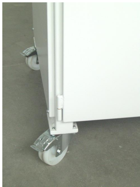
Maschine steht auf lenkbaren Laufrollen