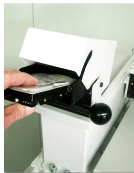
Sondertrichter zur manuellen Aufnahme der Festplatten