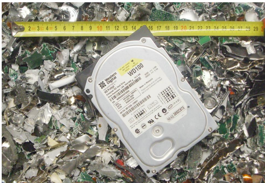
Vor und nach dem Schreddern