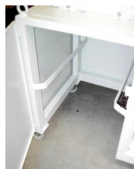
Maschinengestell für 120 l Container