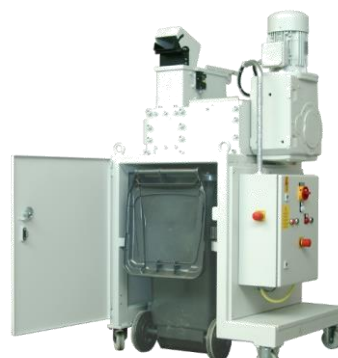
Abb.: JBF HD 15/40 mit 120 l Container (Container nicht im Lieferumfang enthalten)